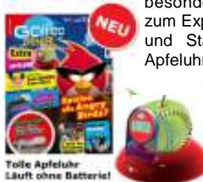
Teile Apfeluhr Läuft ohne Batterie!