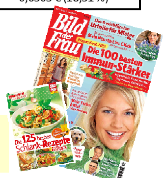
BILD DER FRAU wird im Januar mit TV-Werbung und Zusatznutzen wie z.B. Umhefter mit Schlank-Rezepten unterstützt. wöchentlich VK: 1,20 €